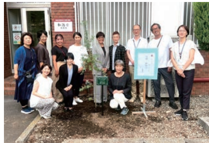
令和7年9月19日(金)新事務局前にて60周年記念植樹

令和7年5月、都市計画道路工事に伴う研修会館の解体により、松徳会事務局は令和7年6月12日に第3体育館1階へ移転いたしました。また開学60周年記念として、令和7年9月19日に新事務局入口前へ1対のミモザを植樹しました。ミモザの花言葉は「友情」「思いやり」「優雅」です。同窓生の皆様の温かい絆が末永く続くよう願いを込めています。大学にお越しの際は、ぜひお立ち寄りください。