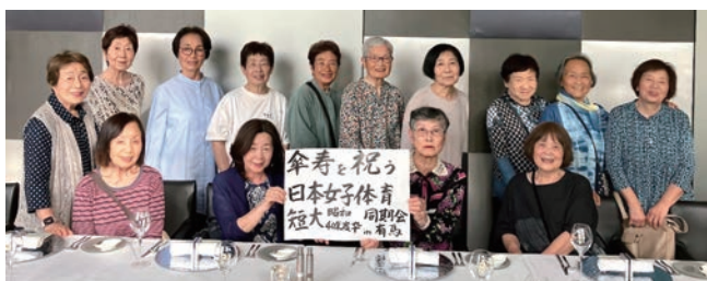
2025年5月28日「エキシブ有馬離宮」にて

残念ですがお世話をするこも、参加することも難しい年齢になりました。今まで開催県でお世話して下さった皆さん、参加して下さった皆さんにこころから感謝いたします。